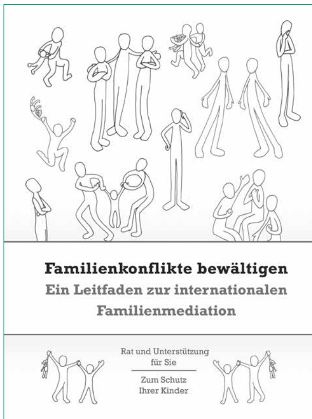
Abb. 2: deutsche Fassung von „Resolving Family Conflicts - A Guide to International Family Mediation“, ISS GS 2014

Fälle, in denen Kinder aus vielfältigen Gründen nicht in ihrer Herkunftsfamilie verbleiben können und fremduntergebracht werden müssen, können auf unterschiedliche Weise von Auslandsbezug betroffen sein. Eine häufige Fallkonstellation, mit der der ISD im Bereich grenzüberschreitender Vollzeitpflege beschäftigt ist, ist die Unterbringung von Kindern bei Verwandten im Ausland. Diese wenden sich entweder selbst an einen ISS-Arbeitspartner oder werden von Fachstellen angesprochen. Ihre Bereitschaft und Eignung müssen dann vor Ort überprüft und die zuständigen Behörden im Land der anvisierten Unterbringung in Kenntnis gesetzt oder um Erlaubnis gebeten werden. Je nach Erfordernis des Einzelfalls begleitet der ISD solche Pflegeverhältnisse durch Beratung, Berichtseinholung, Unterstützung bei der Integration und beim Umgang mit der Herkunftsfamilie oder auch bezüglich etwaiger Rückführungsoptionen.