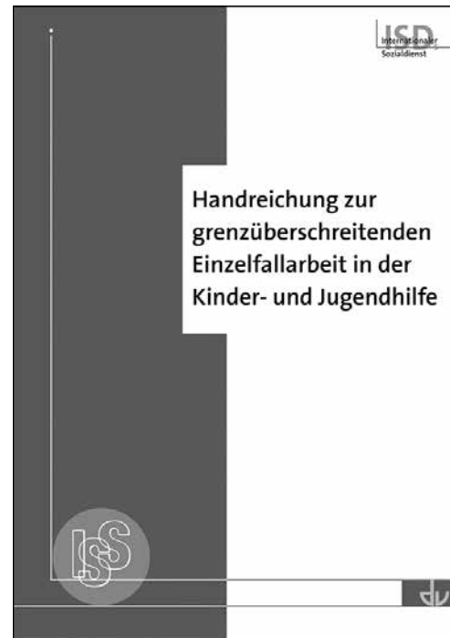
Abb. 3: Cover der Publikation

die Beratungsmethode und die Beratung selbst auf das Erkennen der Interessen und Bedürfnisse der Beteiligten und das Entwickeln nachhaltiger Lösungen ab. Der ISD hat sich bewusst dagegen entschieden, selbst Mediation anzubieten, sondern nur dazu zu beraten. An der Diskussion und Entwicklung von für die Mediation in grenzüberschreitenden Kindschaftskonflikten geeigneten Methoden und Netzwerken hat er sich aber immer beteiligt. 49 So sind auch mit seiner Mitwirkung nicht nur ein Ratgeber für Mediation im Familienkonflikt, sondern auch eine umfassende internationale Webseite entstanden. 50